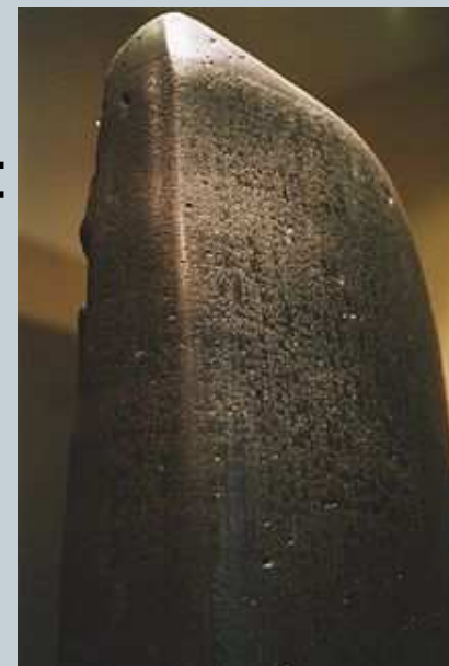
Chammurapiho zákoník Obr. 1